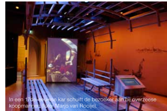
In een 17de-eeuwse kar schuift de bezoeker aan bij overzeese koopmannen.

Al met al heeft Het Scheepvaartmuseum een flinke vernieuwingsslag gemaakt. Van Keulen: “Maar we zijn er nog niet. Onze stagiaires doen nu onderzoek naar een educa-