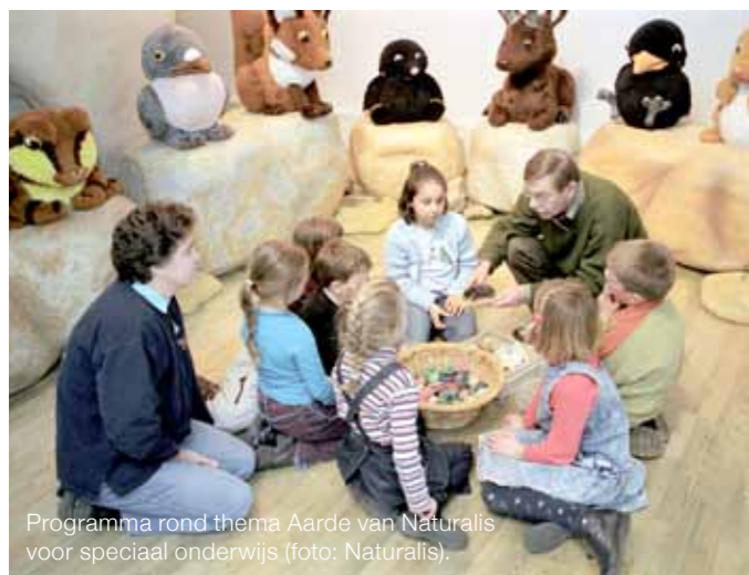
Programma rond thema Aarde van Naturalis voor speciaal onderwijs.

Zowel het Nederlands Openluchtmuseum in Arnhem als Naturalis in Leiden ontvangen veel groepen leerlingen uit het speciaal onderwijs. Veel tips van Scherpenisse zijn herkenbaar in hun aanbod. Zo is bij beide instellingen de voorbereiding op school belangrijk. En de scholen zijn altijd betrokken bij de totstandkoming van programma's.