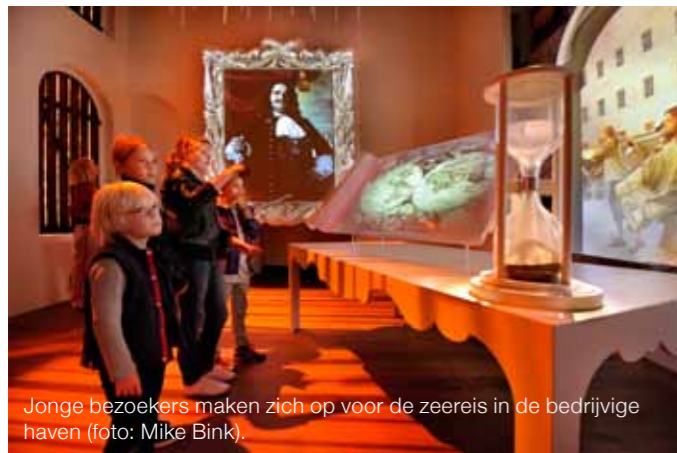
Jonge bezoekers maken zich op voor de zeereis in de bedrijvige haven.

Interesse opwekken, dat is ook waar het om draait in de museumles bij de havententoonstelling, geschikt voor leerlingen van groep 7 en 8 en voor de onderbouw van het vmbo. “Veel mensen weten niet dat Amsterdam een belangrijke haven is”, legt Van Keulen uit. “Er zit veel toekomst en werkgelegenheid in. De Amsterdamse haven heeft aangeboden ons te helpen bij een programma dat aansluit bij die boodschap. Door ze op een speelse manier de haven te laten ontdekken, kunnen kinderen zien dat het een leuk gebied is en wellicht een leuke plek om later te werken. Of dat reclame is? Dat is een interessante discussie. Ik denk het niet. De haven is een belangrijk onderwerp bij aardrijkskunde en economie, maar als oud-aardrijkskundedocent weet ik hoe het in schoolboeken behandeld wordt: het is erg theoretisch en functioneel, maar het sluit niet aan bij de belevingswereld van vmbo’ers. Bij ons gaat de haven leven, zodat het lesmateriaal uit boeken toegankelijker wordt. En daarnaast leren scholieren bronnen gebruiken en beoordelen, samenwerken in een groep, reflecteren,