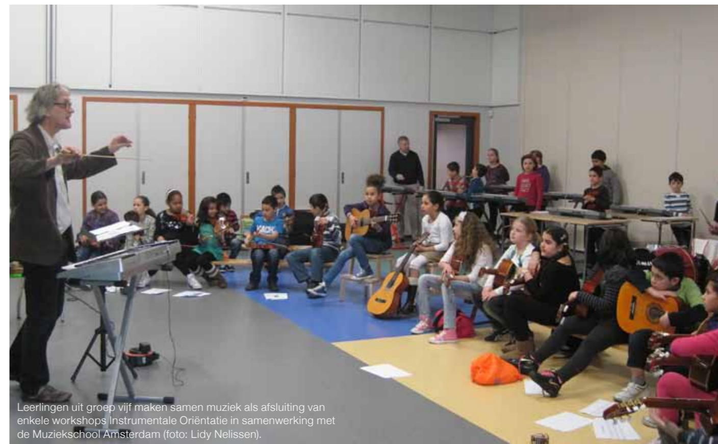
Leerlingen uit groep vijf maken samen muziek als afsluiting van enkele workshops Instrumentale Oriëntatie in samenwerking met de Muziekschool Amsterdam.

leren dat instrument tot in hun laatste schooljaar bespelen. Dit alles onder begeleiding van vakdocenten van de muziekschool. Met dezelfde muziekschool loopt ook een samenwerking voor de kleuters: die krijgen een half jaar