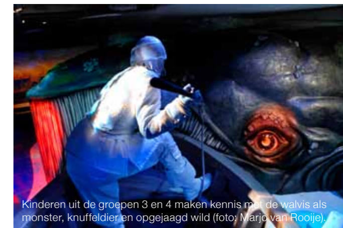
Kinderen uit de groepen 3 en 4 maken kennis met de walvis als monster, knuffeldier en opgejaagd wild.

Omdat scholieren maar tien procent van het totale bezoekersaantal vormen, is de canon in het museum niet leidend gemaakt. “Maar natuurlijk heb ik wel gekeken waar de canon aan bod kan komen en hoe we met onze museumlessen kunnen aansluiten bij de curricula van scholen”, stelt Van Keulen. “Bovendien heb ik alle teksten nageslagen op terminologie in schoolboeken en hebben we aangegeven aan welke kerndoelen we willen bijdragen.” Het museum pretendeert niet schoolboekvervangend zijn. “We zouden het kunnen zijn, want als je alle bijschriften zou lezen, weet je als scholier precies wat er in je geschiedenisboek staat. Maar wie leest nu al die bordjes? Daarom