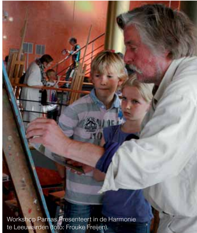
Workshop Parnas Presenteert in de Harmonie te Leeuwarden.

heeft zich verenigd in het Segno-collectief, dat nu muzieklessen gaat geven, in de meeste gevallen buitenschools. Vooralsnog hebben zich 400 leerlingen bij het Segno-collectief gemeld. Vorig jaar telde de Triangel 1139 leerlingen. Wormgoor: "Ongetwijfeld heeft dit te maken met het feit dat de kosten voor de lessen enorm gestegen zijn, omdat er geen subsidie meer op zit."