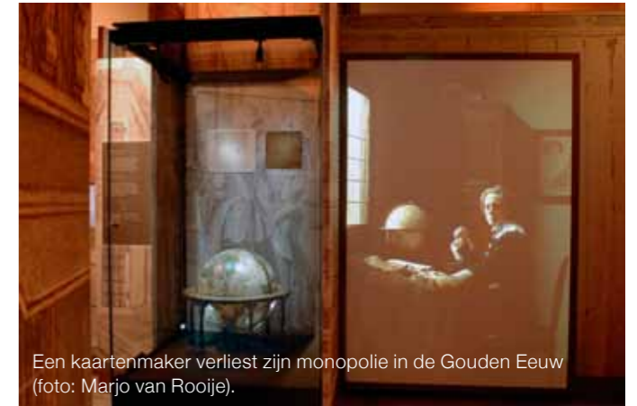
Een kaartenmaker verliest zijn monopolie in de Gouden Eeuw.

tief programma voor pabostudenten. Erfgoededucatie daar zou best wat steun kunnen hebben en dat willen we in 2012 oppakken. We gaan af op de reacties van ervaren pabodocenten om een mooie tentoonstelling te ontwikkelen.”