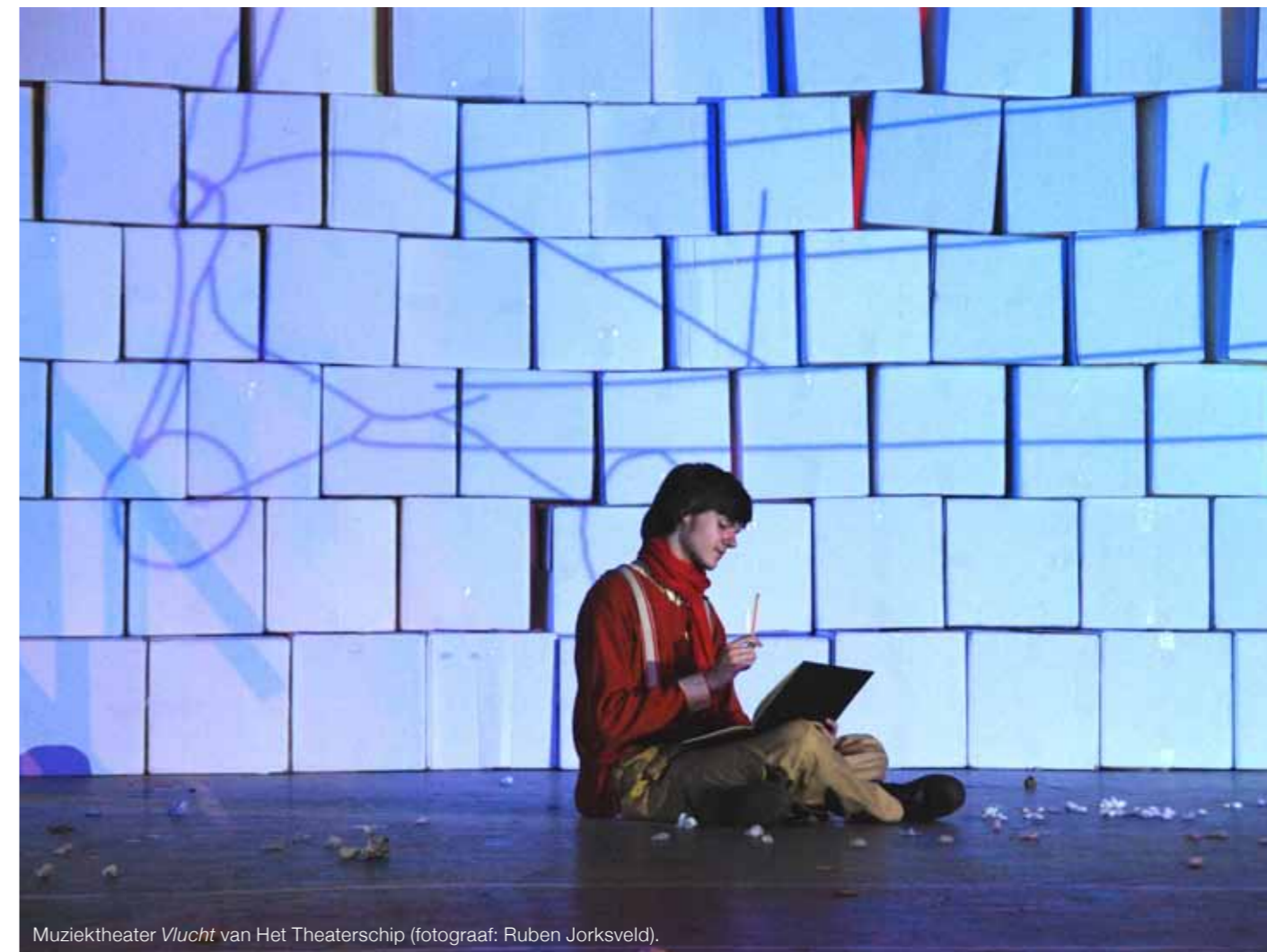
Muziektheater Vlucht van Het Theaterschip.

Een al langer lopend onderwijsproject waarin amateurs samenwerken met professionals is Windkracht 6 . Hierin krijgen leerlingen lessen van een muziekdocent en