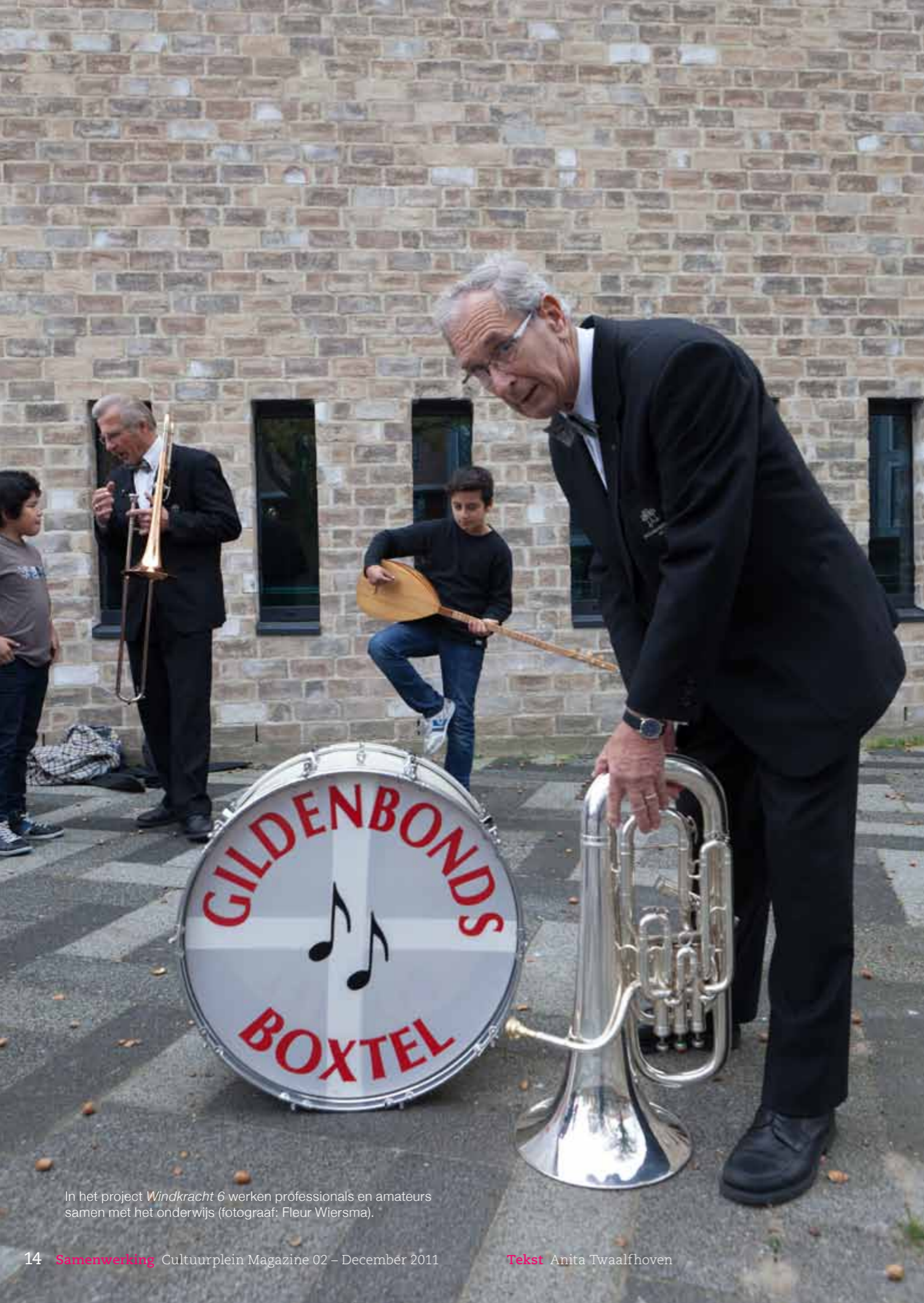
In het project Windkracht 6 werken professionals en amateurs samen met het onderwijs.

Ook Het Theaterschip in Deventer, een jeugdtheaterschool en huis voor de amateurkunst, krijgt subsidie van het fonds om amateurs en professionals samen te brengen. Met deze extra middelen wordt een festival georganiseerd en