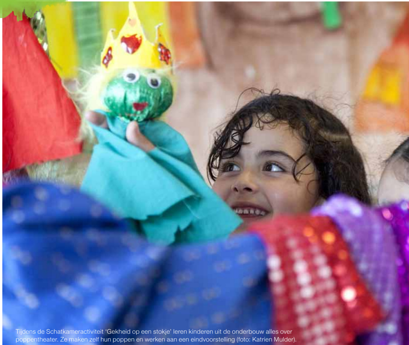
Tijdens de Schatkameractiviteit 'Gekheid op een stokje' leren kinderen uit de onderbouw alles over poppentheater. Ze maken zelf hun poppen en werken aan een eindvoorstelling.