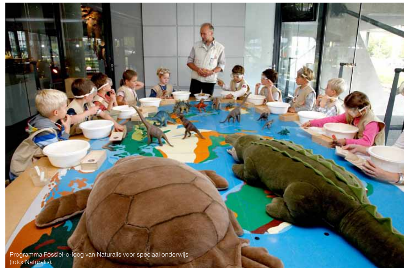
Programma Fossil-o-loog van Naturalis voor speciaal onderwijs.

hebben altijd zijn speciale belangstelling gehad, wellicht als gevolg van de halfzijdige gezichtsverlamming waarmee hij zelf werd geboren. Hij heeft jaren in het speciaal onderwijs gewerkt en organiseert nu dansactiviteiten voor deze doelgroep. Het woord ‘beperkingen’ komt in zijn vocabulaire niet voor. “Ben je gek, deze kinderen hebben juist