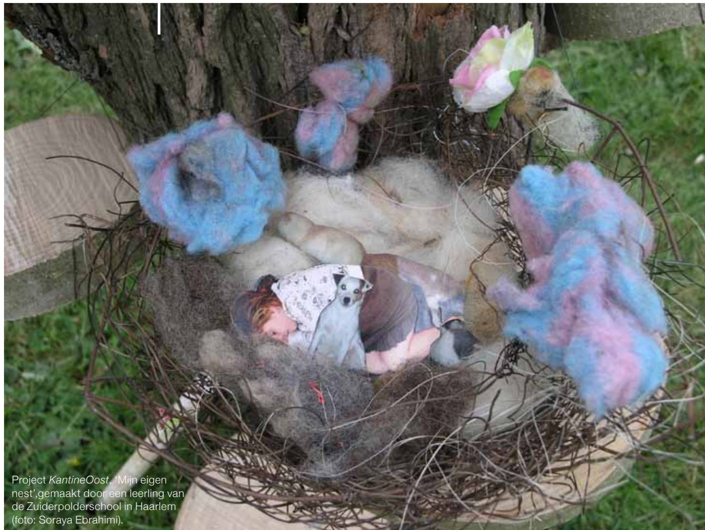
Project KantineOost. "Mijn eigen nest", gemaakt door een leerling van de Zuiderpolderschool in Haarlem.