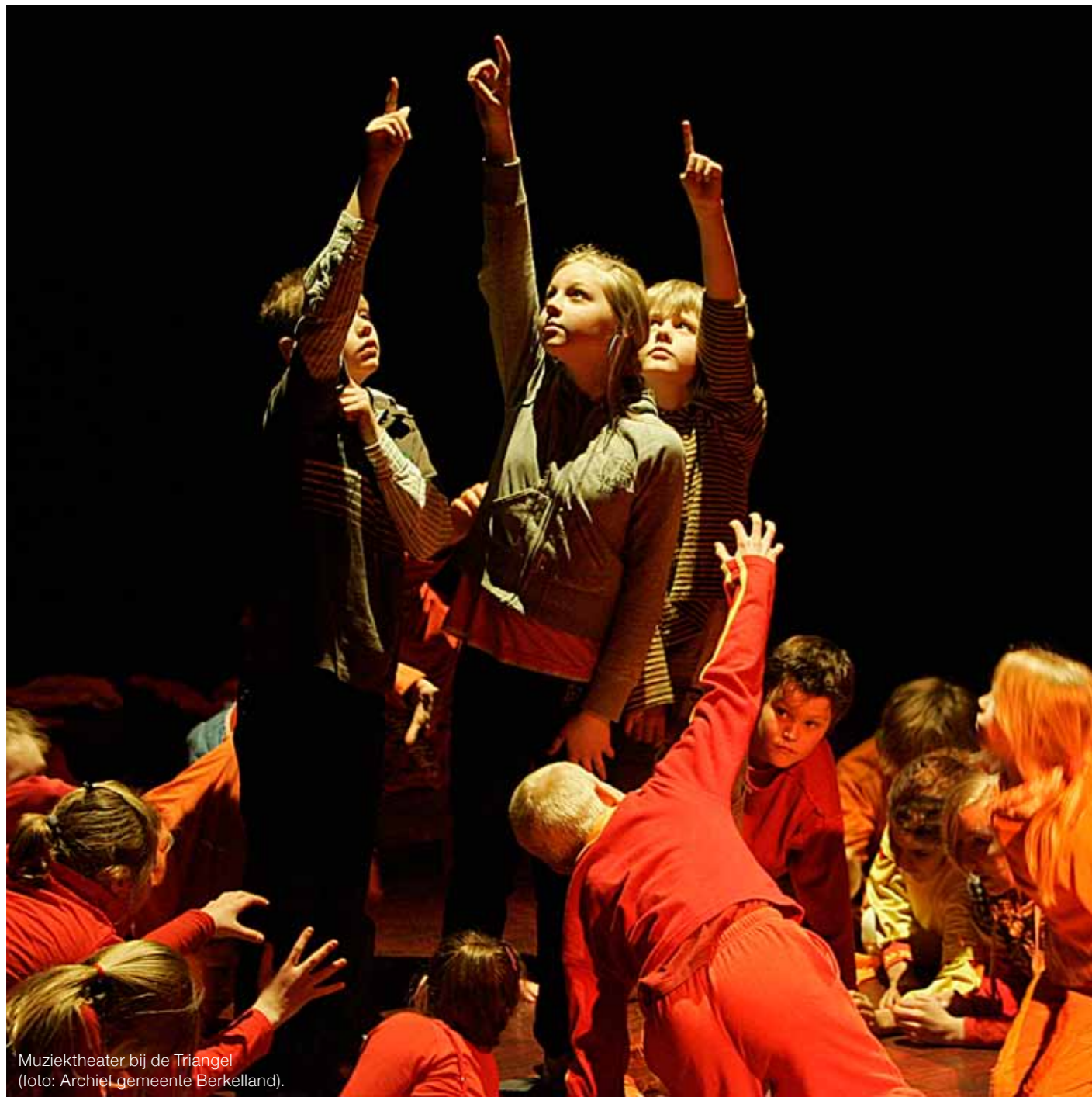
Muziektheater bij de Triangel.

‘Historisch!’ Anders kan de cultuursector de huidige bezuinigen niet noemen. Bovenop de landelijke en de provinciale kortingen, dalen de subsidiebudgetten van gemeenten ook drastisch. Dit kan ingrijpende gevolgen hebben: centra voor de kunsten verdwijnen, vakdocenten verzelfstandigen, aanbieders vragen meer geld en kwaliteit komt in het gedrang.