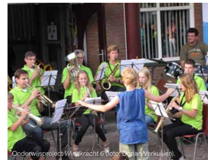
Onderwijsproject Windkracht 6.