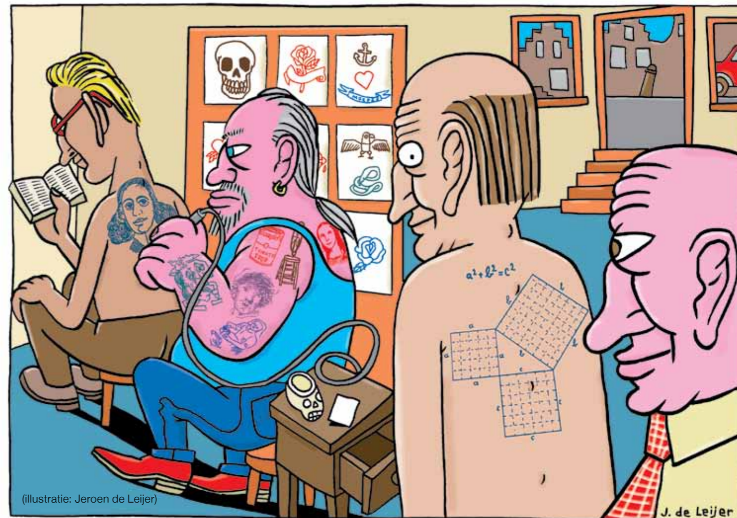
(illustratie: Jeroen de Leijer)

“Kunst en cultuur hebben een functie in de algemene ontwikkeling van mensen en in de ontwikkeling van talenten, mede in het belang van de Nederlandse kenniseconomie. Er zijn in het licht van het landelijk onderwijsbeleid drie ontwikkelingen waar mensen die onderwijs in kunst en cultuur belangrijk vinden bij zouden moeten aanhaken. Ten eerste nadrukkelijk de verbinding leggen met basisvaardigheden. De beweging naar meer opbrengstgericht werken, gepaard gaand met kwantitatief en cijfermatig beoordelen van prestaties, kan een bedreiging zijn voor onderwijs in kunst en cultuur. Het morele argument ‘vorming is belangrijk’ vindt steeds minder weerklank bij scholen. Aantonen van de bijdrage aan algemene competenties en effecten op andere leergebieden kan scholen overtuigen prioriteit te geven aan cultuuronderwijs.