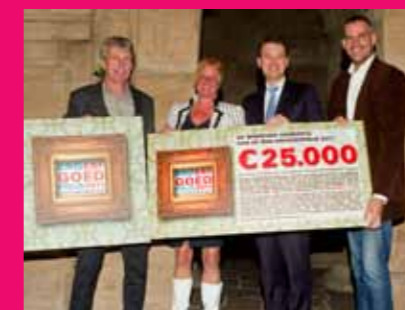
Staatssecretaris Zijlstra reikt de BNG Erfgoedprijs uit aan de gemeente Westerveld.

Westerveld is dunbevolkt en heeft weinig monumenten. Ondanks dat laat zij zien dat je met weinig middelen en veel enthousiasme een veelzijdig en actief erfgoedbeleid kunt neerzetten. Westerveld gebruikt cultuurhistorie als drager voor haar identiteit en verbindende factor tussen haar kernen, ook voor toekomstige generaties. Daarom verdiende de gemeente Westerveld deze prijs.”