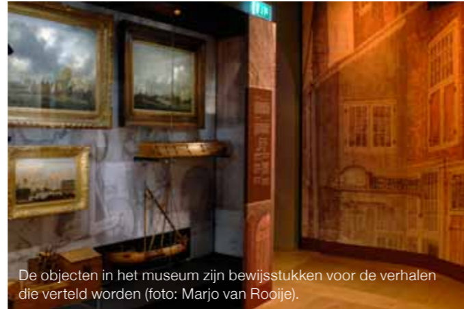
De objecten in het museum zijn bewijsstukken voor de verhalen die verteld worden.