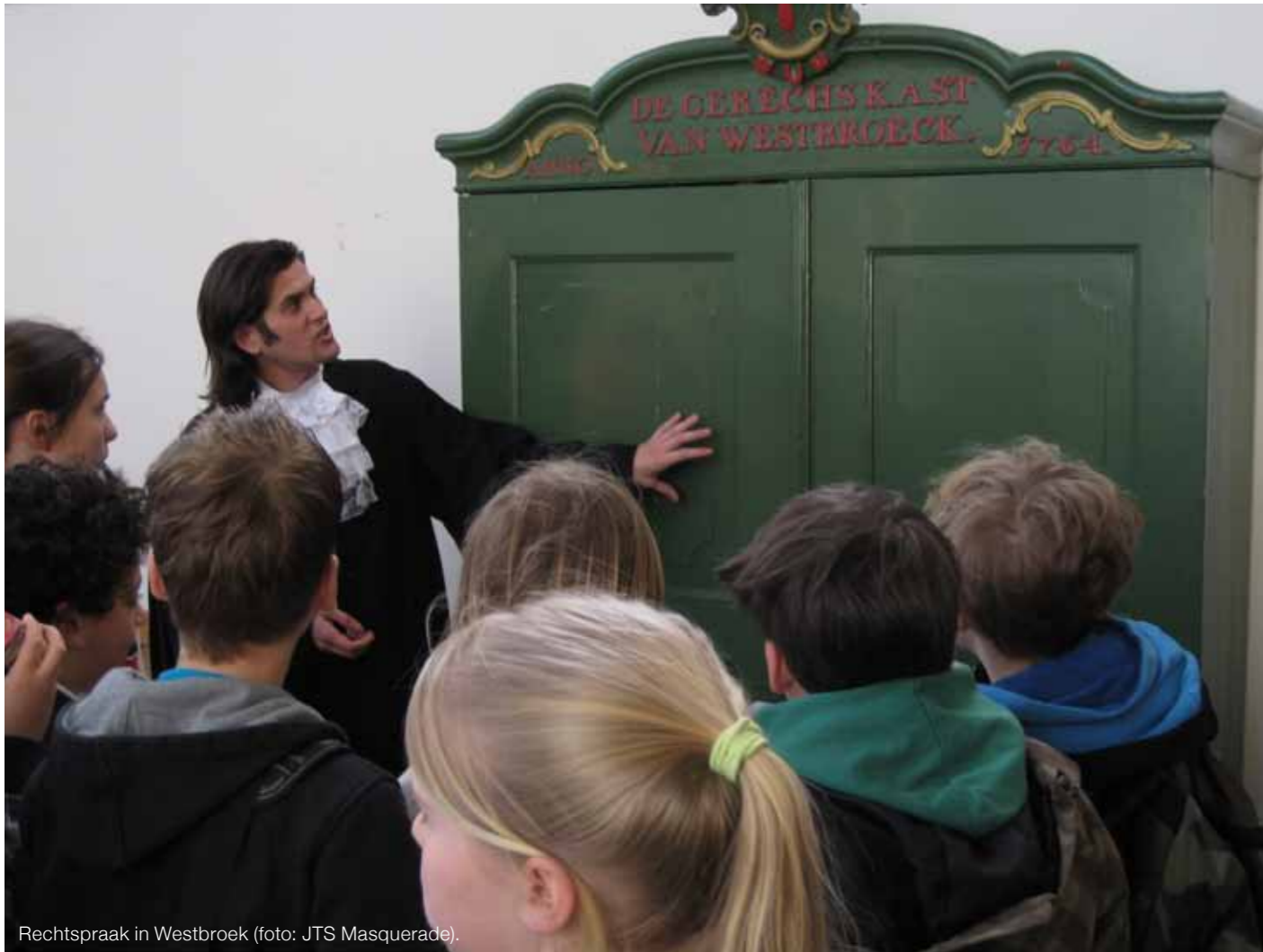
Rechtspraak in Westbroek.