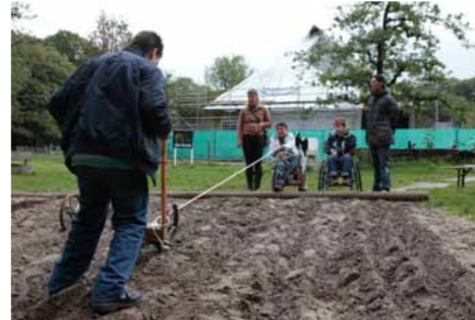
Leerlingen van Lichtenbeek zijn bezig met activiteiten uit het project Brood in het Nederlands Openluchtmuseum in Arnhem.

Een andere aanpassing is de kijkopdracht bij de oogst. Voor reguliere groepen zitten alle stappen erin en wordt