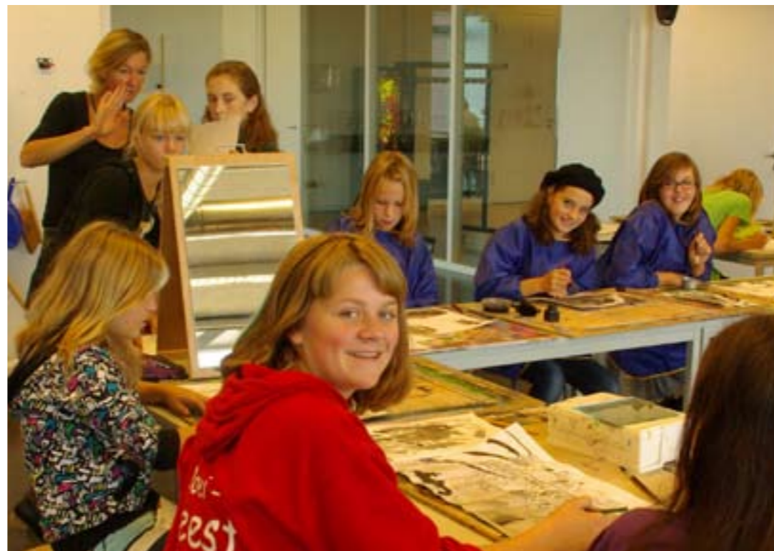
Docent van Scholen in de Kunst geeft les op het Vathorst College.

Ook in de gemeente Schouwen-Duiveland zijn scholengemeenschap Pontes Pieter Zeeman en enkele culturele instellingen voornemens om de