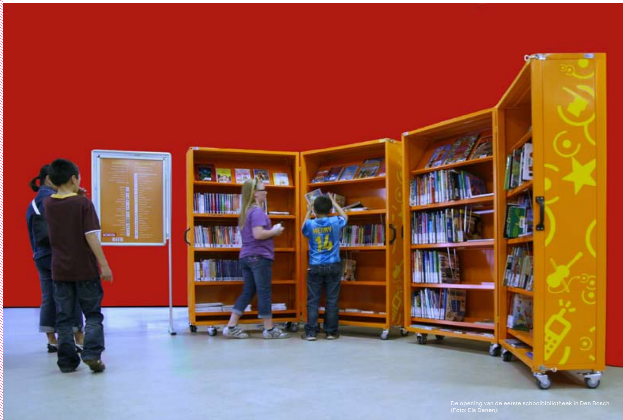
De opening van de eerste schoolbibliotheek in Den Bosch (Foto: Els Danen).

Dat je met boeken en leesplezier niet vroeg genoeg kunt beginnen, is de filosofie achter BoekStart . Deze programmalijn is gericht op jonge ouders. Als hun baby drie maanden is, krijgen ze van de gemeente een uitnodiging om bij de bibliotheek het BoekStartkoffertje op te halen: een koffer met een stoffen babyboekje, een cd met kinderliedjes, een boekenlegger en een informatiefolder. De bibliotheekmedewerker leidt de ouders rond