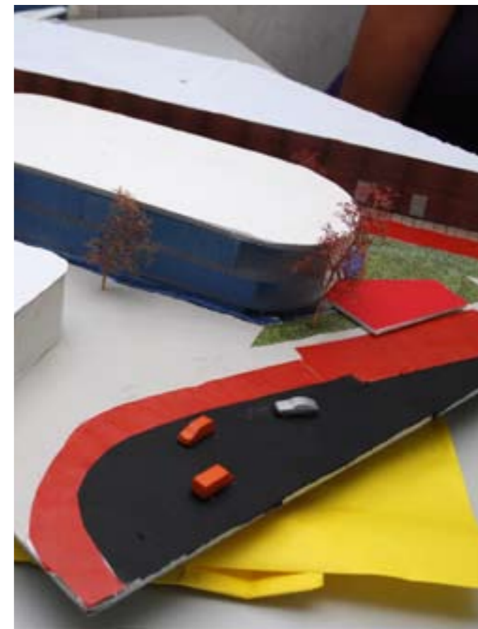
Het winnende ontwerp 2010, goed uitgewerkt op alle schaalniveau's.