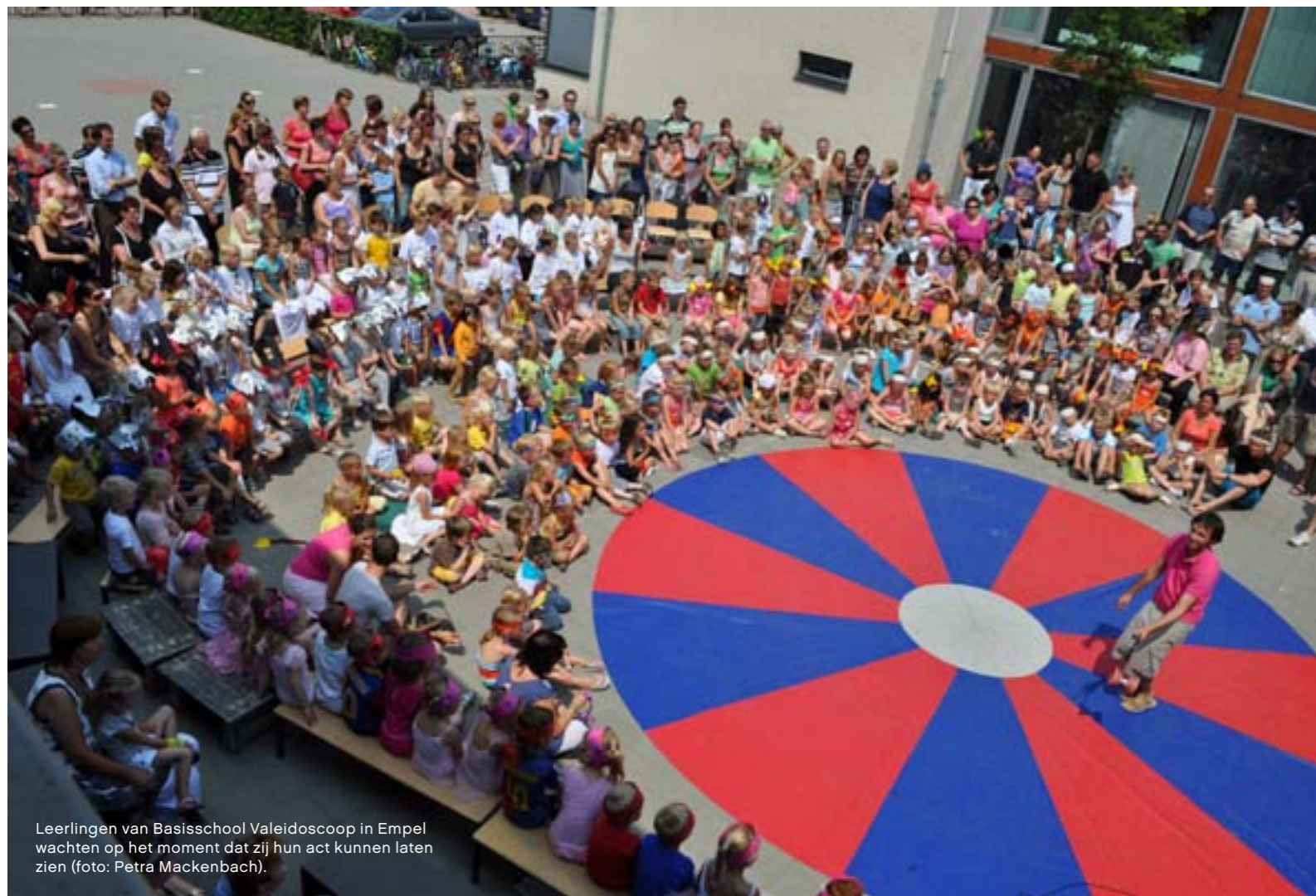
Leerlingen van Basisschool Valeidoscoop in Empel wachten op het moment dat zij hun act kunnen laten zien.

Grote Broer vindt dat elk kind recht heeft op een ontmoeting met kunst. Daarom is de organisatie op zoveel plekken te vinden. Theaterdocent Hormes: “Je moet kinderen en jongeren zó onderdompelen in een kunstproject, dat ze aan het slot ervan paf staan van wat zij zelf voor elkaar hebben gekregen.”