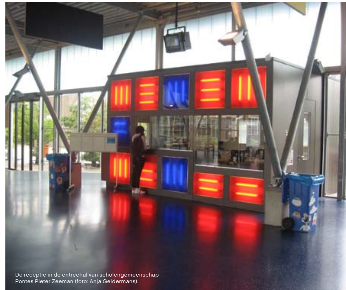
De receptie in de entreehal van scholengemeenschap Pontes Pieter Zeeman.