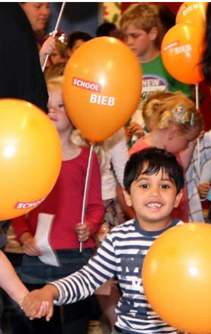
De opening van de eerste schoolbibliotheek in Den Bosch.

“Het gaat erom dat kinderen meer en beter leesmateriaal in handen krijgen: passender, prikkelender en meer aansluitend bij interesses van het kind.”