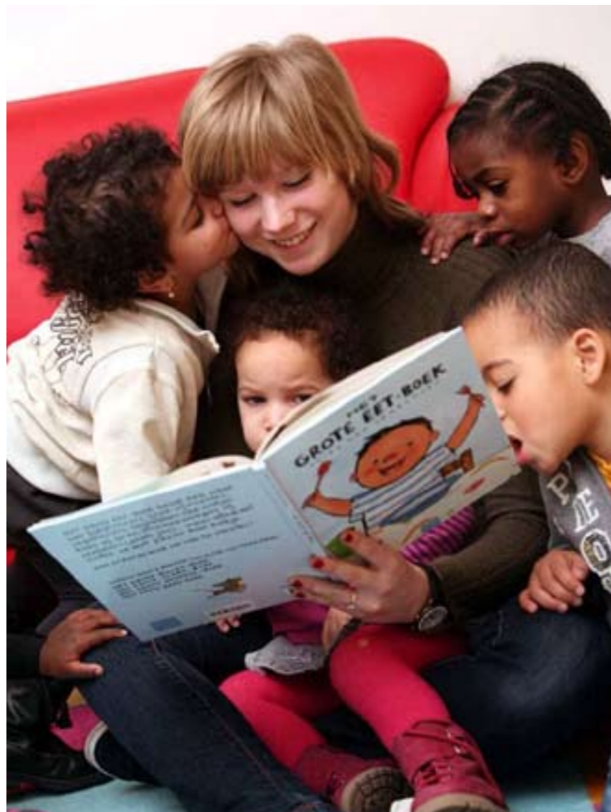
Voorlezen in het kader van BoekStart.

Haring vond de voorleeswedstrijd een heel goed initiatief: