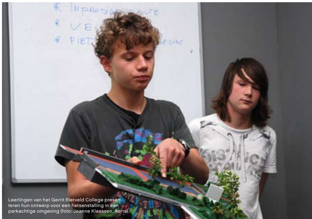
Leerlingen van het Gerrit Rietveld College presenteren hun ontwerp voor een fietsenstalling in een parkachtige omgeving.