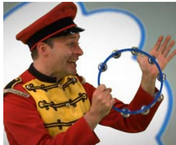
Still uit lesmethode Bennie Briljant .