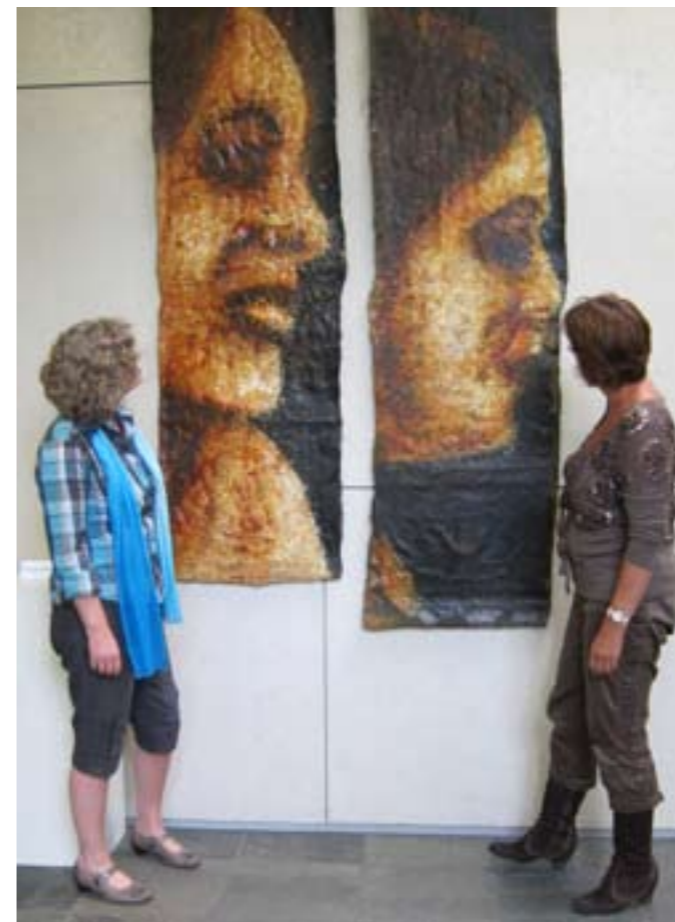
Door de school aangekocht kunstwerk dat gebruikt wordt in het cultuuronderwijs.

speelt een centrale rol. In elk lokaal is er een te vinden en elke dag begint met bijbellezen, gebed en zang. Ook in het cultuuronderwijs speelt het evangelie een belangrijke rol. De school heeft een open houding naar de wereld. De studenten leren werken volgens de principes van meervoudige intelligentie en vakoverstijgend onderwijs. Veel studenten gaan na hun studie aan het werk op een gereformeerde basisschool, anderen kiezen voor protestants-christelijk onderwijs en een enkeling voor het openbaar onderwijs.