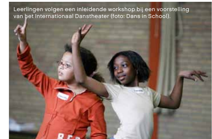
Leerlingen volgen een inleidende workshop bij een voorstelling van het Internationaal Danstheater.