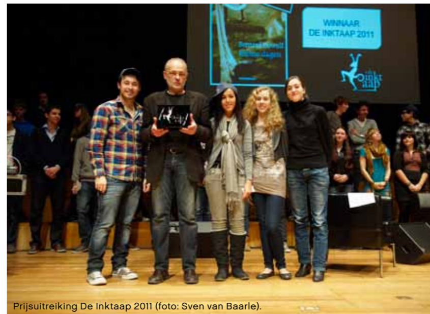
Prijsuitreiking De Inktaap 2011.