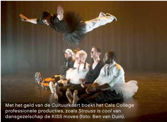
Met het geld van de Cultuurkaart boekt het Cals College professionele producties, zoals Strauss is cool van dansgezelschap de KISS moves.

zien leerlingen daarom regelmatig voorstellingen van bijzondere, goed aangeschreven staande theatermakers als Léon Giesen en dansgezelschappen als de KISS Moves. Die worden met collectief geld van de Cultuurkaart betaald. "We vinden het belangrijk om leerlingen in aanraking te laten komen met vormen van cultuur die ze uit zichzelf misschien niet snel kiezen." Kwaliteit bieden kan alleen als er voldoende budget is, stelt Meijer. "De dansvoorstelling Strauss is cool was vrij duur: je haalt immers 14 dansers, een choreograaf en technici in huis. Het was een pittige voorstelling, waar de leerlingen het nog steeds over hebben. Als we straks minder geld te besteden hebben, kunnen we ons geen professionele gezelschappen meer veroorloven. Tenzij we een ouderbijdrage invoeren." Dat de school eigen faciliteiten heeft, waaronder muziekllokalen, oefenstudio's, een repetitieruimte en een theaterzaal, scheelt overigens wel aanzienlijk in de kosten. "Daardoor hoeven niet steeds een zaal af te huren."