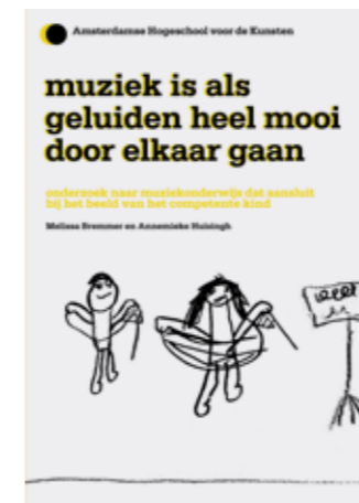
Onderzoeken gedaan bij het Lectoraat Kunst en Cultuureducatie aan de Amsterdamse Hogeschool voor de Kunsten.

de monitoring van de onderzoeksbureaus voor een deel, maar eigenlijk is dit ook een taak voor het onderwijs. Daarnaast proberen we al jaren bij de Nederlandse Organisatie voor Wetenschappelijk Onderzoek, aandacht voor cultuureducatie te vragen. Maar de subsidieaanvragen worden helaas steeds afgewezen omdat ze andere prioriteiten heeft.” De conferentie is in vijf jaar tijd uitgegroeid tot een vaste plek voor onderzoekers. Bovendien worden er steeds meer papers ingediend over lopend of recent afgesloten onderzoek. Hierbij zoekt Cultuurnetwerk deskundige vakgenoten. Zo ontstaat een steeds bredere kring van onderzoekers en grotere variëteit aan onderzoek. Nu alleen de borreltafel nog.