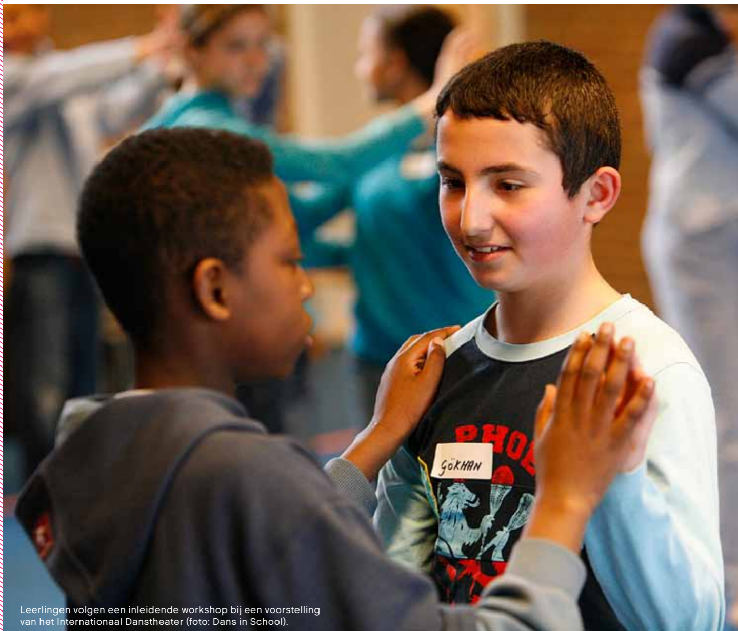
Leerlingen volgen een inleidende workshop bij een voorstelling van het Internationaal Danstheater.