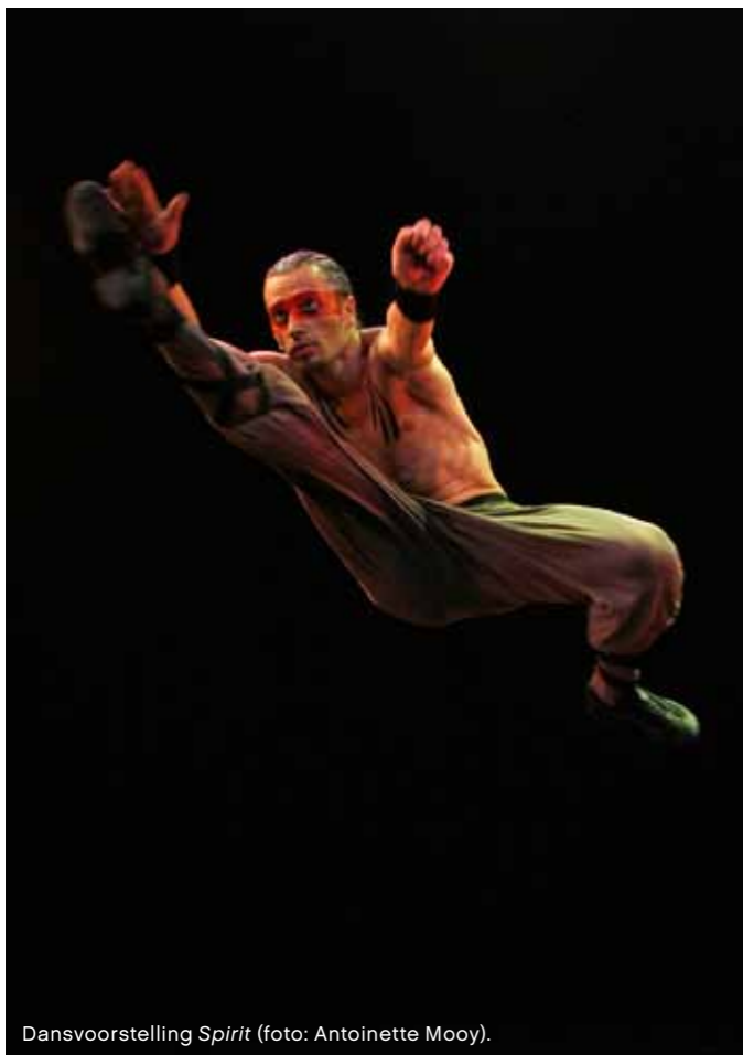
Dansvoorstelling Spirit.