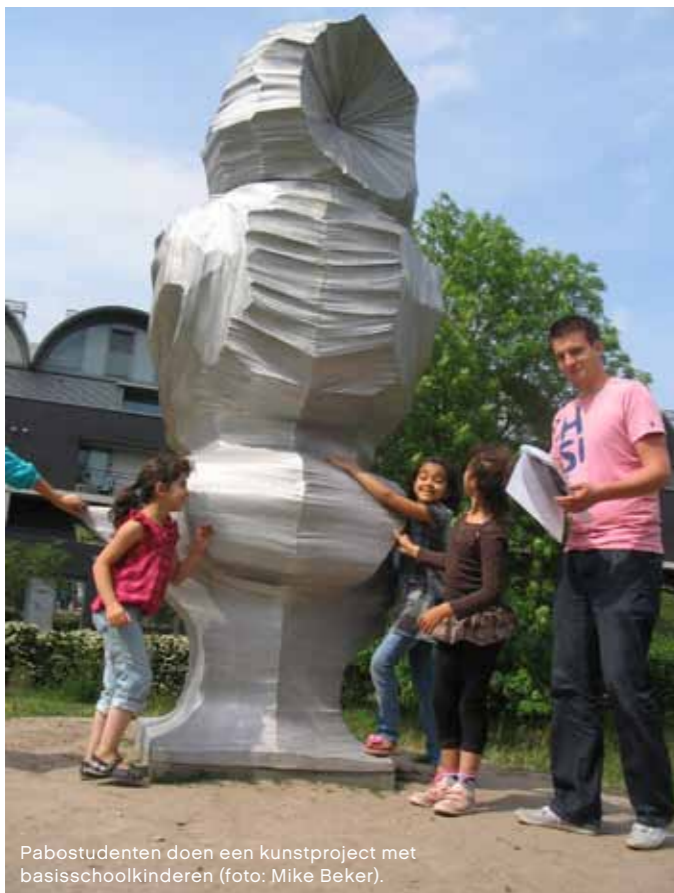
Pabostudenten doen een kunstproject met basisschoolkinderen.

“Ik maakte zelf wel wat lesjes, maar nu kreeg ik de kans een extra slag te maken. De studenten laten een concreet product achter.”