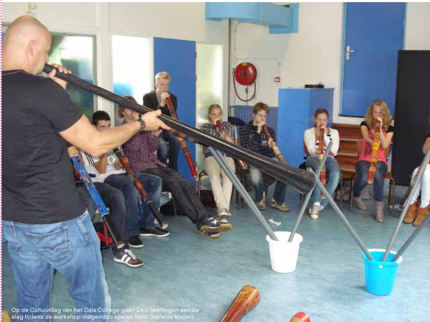
Op de Cultuurdag van het Cals College gaan CKV-leerlingen aan de slag tijdens de workshop didgeridoo spelen.