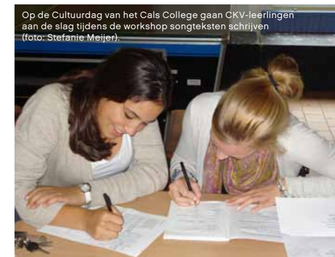
Op de Cultuurdag van het Cals College gaan CKV-leerlingen aan de slag tijdens de workshop songteksten schrijven.