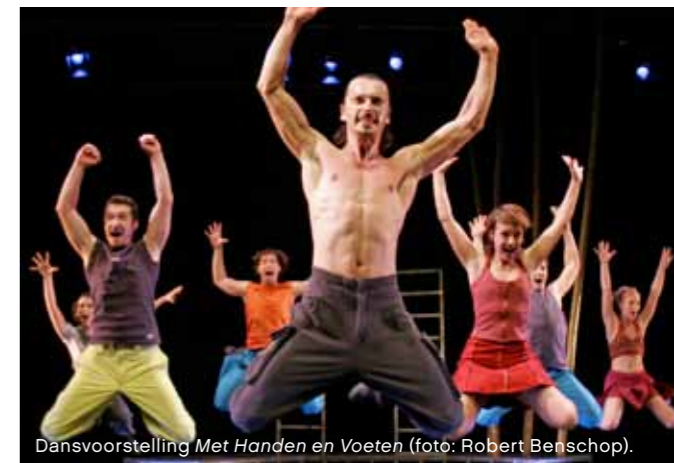
Dansvoorstelling Met Handen en Voeten.

streetdance komt, om mee te doen aan een 'traditionele' voorstelling van ons."