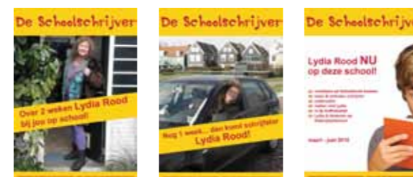
Posters voor De Schoolschrijver.