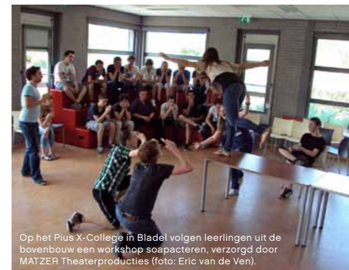
Op het Pius X-College in Bladel volgen leerlingen uit de bovenbouw een workshop soapacteren, verzorgd door MATZER Theaterproducties.