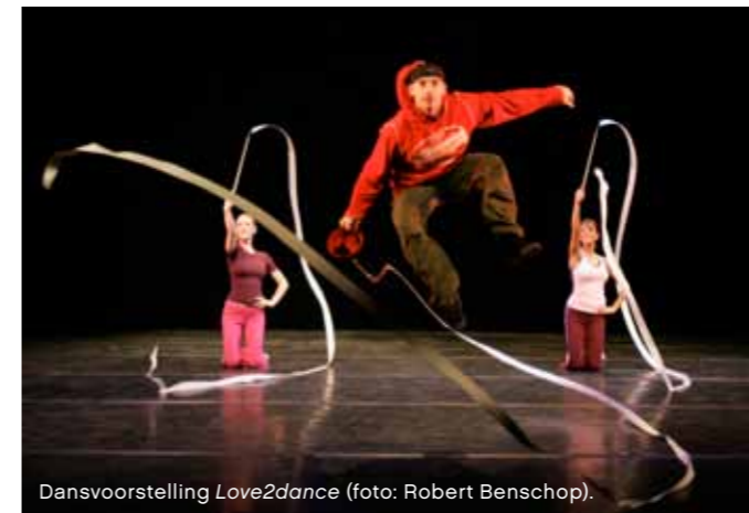
Dansvoorstelling Love2dance.

Een van de manieren om die vernieuwing door te voeren is door meer samen te gaan werken met anderen, zoals ISH, Danstheater Aya en dansgezelschap Don't hit mama. "We vissen in dezelfde vijver. Het is in deze tijd onvermijdelijk dat we elkaar opzoeken. Zij zouden gebruik kunnen maken van de faciliteiten van onze zaal en we kunnen elkaar ook inspireren. Door jongeren uit andere hoeken binnen te halen, ontstaat er een mooie wisselwerking. Wij hebben bijvoorbeeld choreografe Alida Dors gevraagd, die uit de hoek van de hiphop en