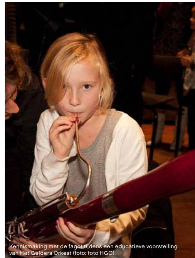
Kennismaking met de fagot tijdens een educatieve voorstelling van Het Gelders Orkest.