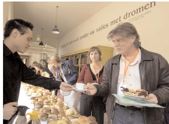
'Bestijg de trein nooit zonder uw valies met dromen' staat er op de wand in het pas heropende Spoorwegmuseum. Uit: Bericht aan de reizigers (1934) van Jan van Nijlen.