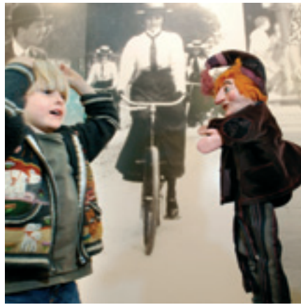
Kleuterprogramma Oma's Tijd in het Amsterdams Historisch Museum

rijk. 'Door de kleuters op school een dvd te laten zien met de hoofdrolspeler van een project, bijvoorbeeld de muis, maak je ze al bekend met het typetje dat hen in het museum ontvangt.' Scholen kunnen zelfs