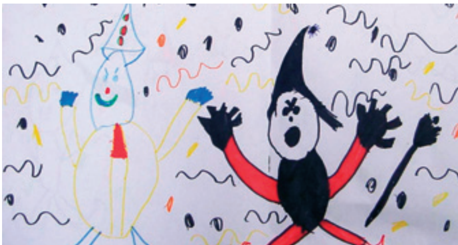
De taalzwakke Elco maakte na een feest een tekening en begon vervolgens te praten over wat hij had getekend. Depondt: ‘Het beeldend werken gaf Elco “voeding” om te verwoorden.’

Via de kunst en de expressie kan het kind