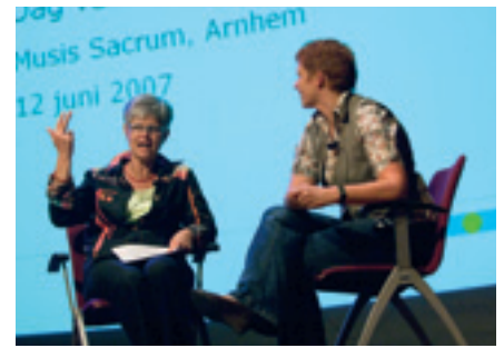
Interview met een vmbo-docent (rechts): 'Mijn leerlingen zijn erg streetwise en overtuigd van hun eigen kunnen, maar eigenlijk kunnen ze niet zoveel.'

Koene citeerde Nelleke Douw van de culturele instelling Het Koorenhuis. 'De sleutel tot